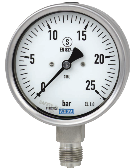
Manometro a molla tubolare modello 232.30